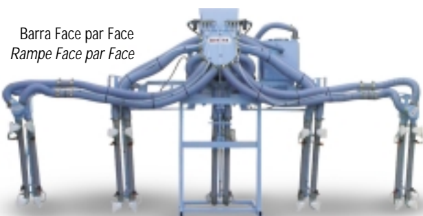
Barra Face par Face Rampe Face par Face