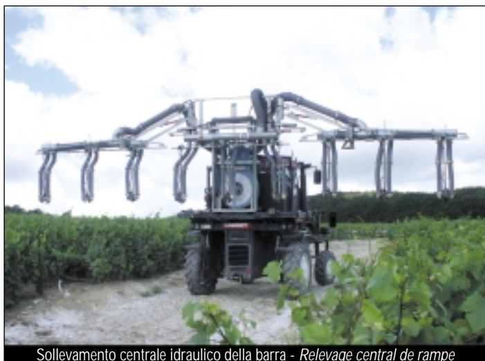
Sollevamento centrale idraulico della barra - Relevage central de rampe