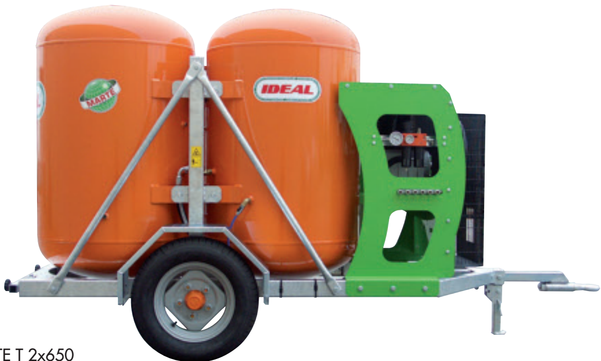
MARTE T 2x650

MARTE, gracias a la grande capacidad de aire de sus depósitos, permite accionar varias tijeras para muchas horas con el tractor apagado, reduciendo de esta manera el desgaste de las partes mecánicas, los consumos de carburante y también la contaminación acústica y atmosférica. Los modelos MARTE son propuestos en dos versiones enganchadas a los tres puntos del tractor, con depósito vertical y/o horizontal, y dos versiones remolcadas, para satisfacer de la mejor manera las distintas exigencias de las empresas agrícolas. Está disponible también la versión remolcada autónoma, con motor diesel, con el sistema especial de apagado y encendido automáticos.