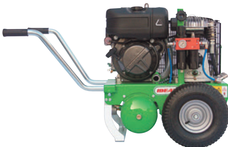
GIOVE 540 D

GIOVE 1250 D mit 11 PS-Dieselmotor von Lombardini mit elektrischem Anlasser, für den Betrieb von 4/5 Schlagvorrichtungen, 2 Sägen und/oder 12 Scheren.