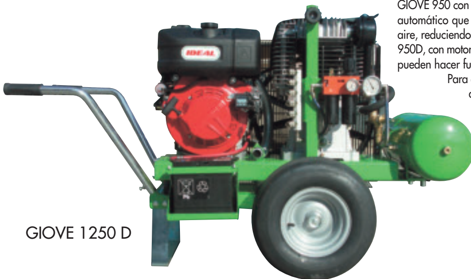
GIOVE 1250 D

GIOVE 1250D avec moteur Lombardini diesel de 11 ch, démarrage électrique. Il peut actionner 4/5 peignes, 2 tronçonneuses et/ou 12 sécheurs.