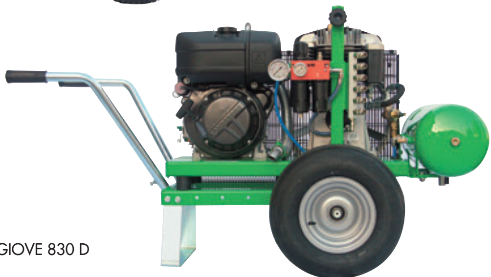
GIOVE 830 D