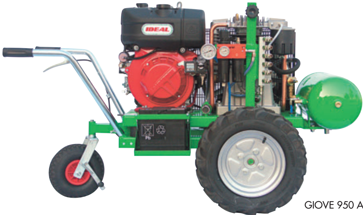
GIOVE 950 AD