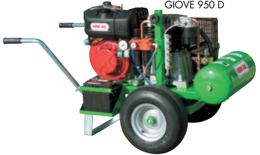
GIOVE 950 D