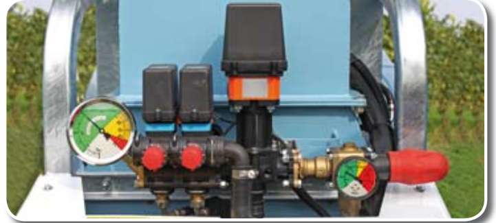
Kit valvole elettriche - Kit vanne électriques - Electric valves set Kit Elektro-Bedienungseinheit - Mando eléctricos